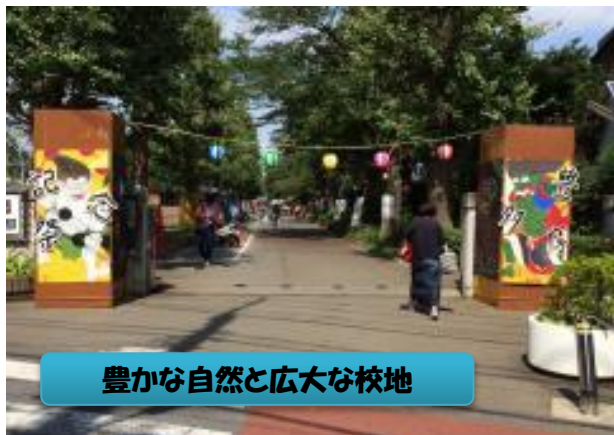
豊かな自然と広大な校地